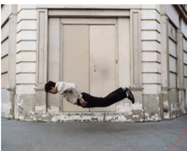
DENIS DARZACQ L'HOMME DANS LA CITÉ

Il sera proposé aux stagiaires de réaliser des portraits; d'eux-mêmes, des autres et de s'intéresser à cette faculté de la photographie à aborder la question de l'identité.