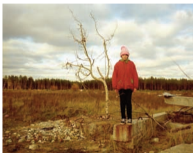
GUILLAUME HERBAUT REPORTAGE CRÉATIF