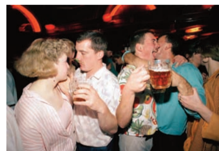
TOM WOOD + GILLES VERNERET STREET PHOTOGRAPHY

Gilles Saussier propose aux stagiaires de venir partager la part maudite et résiduelle de son activité de photographe. Chacun sera invité à projeter ses séries de photographies les moins réussies, à évoquer ses échecs de prises de vue, à déconstruire sa pratique et son rapport à la photographie. Cette démarche sera l'occasion pour les participants de réfléchir au rapport entre ruine et document et à la manière dont un matériau photographique résiduel passé peut être réinvesti ou dilapidé. Chacun pour finir imaginera ou amorcera un projet de livre ou d'exposition à partir de temps et de documents hétérogènes.