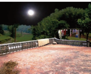
LAURENT MULO IMAGES EN MOUVEMENT

La photographie entre passé et présent à travers la notion de trace. Figure de l'absence, elle interroge notre rapport à l'histoire, mais également à l'identité ou au corps.