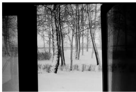
KLAVDIJ SLUBAN L'ART DE VOIR